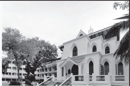
ലൂർദ്ദ് പള്ളി തിരുവനന്തപുരം