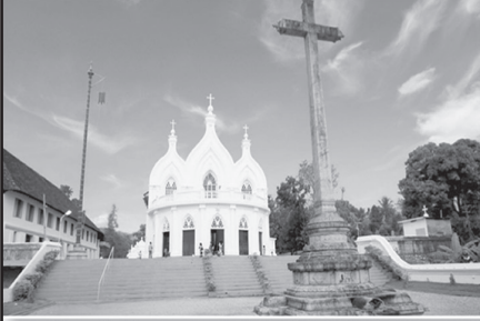
സെന്റ് മൈക്കിൾസ് മെത്രാപ്പോലീത്തൻ പള്ളി ചങ്ങനാശേരി