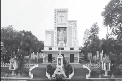
സെന്റ് ഇലിസബത്ത് തീർത്ഥാടനകേന്ദ്രം കൂടമാളൂർ