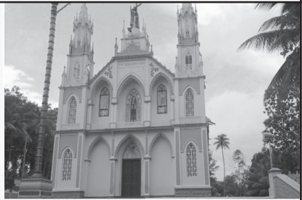
സെന്റ് ജോൺ റി ബാപ്റ്റിസ്റ്റ് പള്ളി നെടുങ്കുന്നം