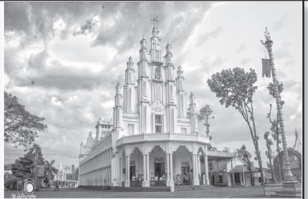
സെന്റ് മൈക്കിൾസ് പള്ളി അതിരമ്പുഴ