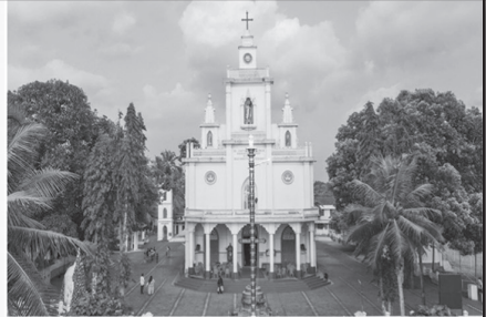
സെന്റ് ആന്ണീസ് പള്ളി കുറുമ്പാടം