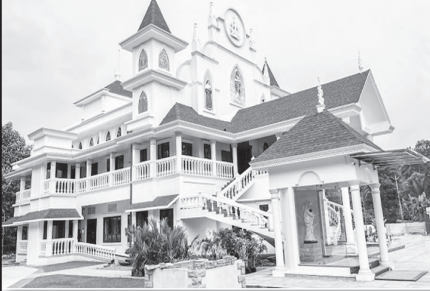
മർത്ത് മറിയം പള്ളി ചെങ്ങന്നൂർ