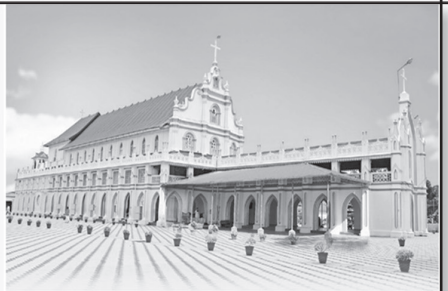
സെന്റ് ജോർജ്ജ് ചർച്ച് എടത്യാ (കോയിൽമുക്ക്)