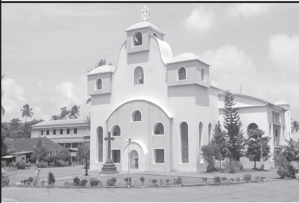
സെന്റ് സേവ്യേഴ്സ് പള്ളി തൃക്കൊടിത്താനം