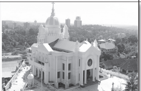
ലൂർദ്ദ് പള്ളി കോട്ടയം