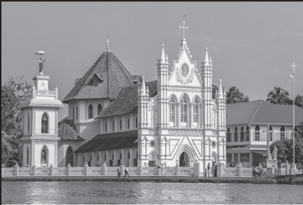
സെന്റ് ഇലിസബത്ത് പള്ളി പുളിങ്കുന്ന്