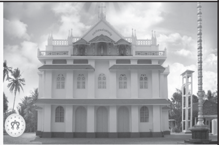
മർത്ത്യമറിയം പള്ളി തുരുത്തി