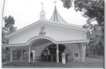
സെന്റ് ജോർജ്ജ് പള്ളി മുഹമ്മ