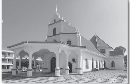
മാർ സ്റ്റീവ്യാ പള്ളി ആലപ്പുഴ