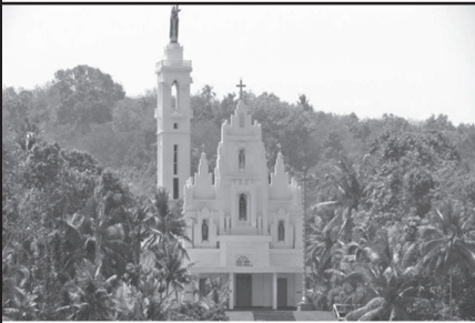
ഹോളി മാരി പള്ളി മണിമല