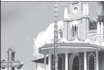
ക്രിസ്തുരാജാ പള്ളി ആയൂർ