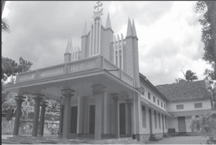
സെന്റ് ജോർജ്ജ് പള്ളി, അമ്പുരി