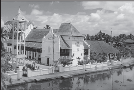
സെന്റ് മൈക്കിൾസ് ബസിലിക്ക ചമ്പക്കുളം (കല്ലൂർക്കാട്)